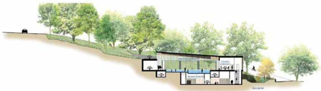
Plan de coupe du nouveau complexe.