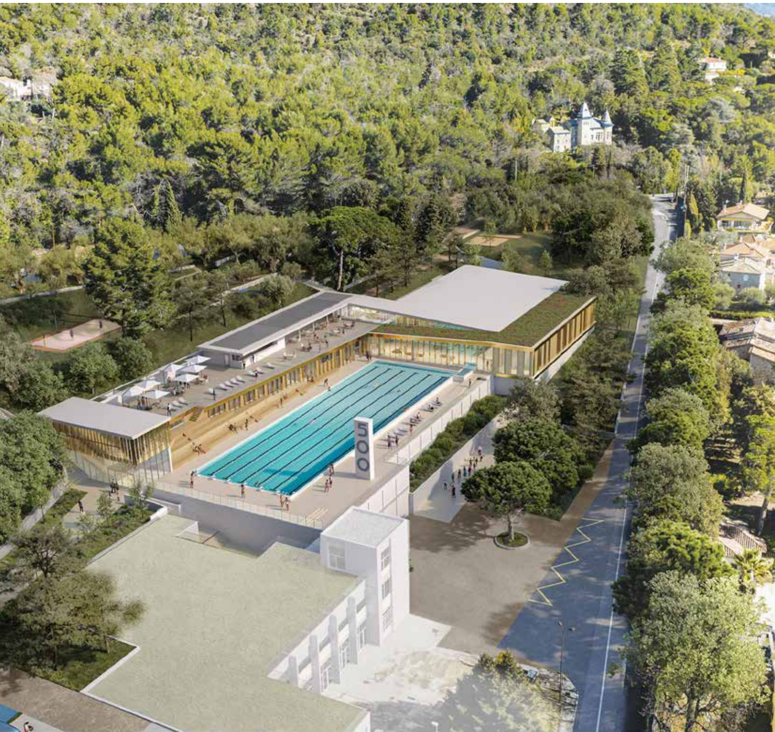
Perspective aérienne du nouveau complexe.