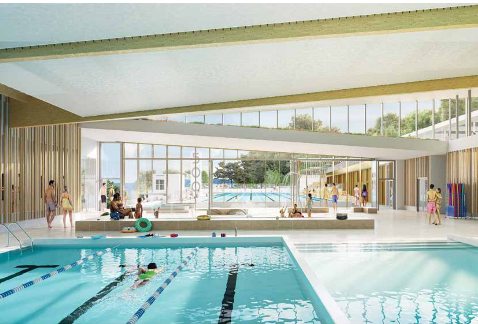
Perspective intérieure du bassin multifonction couvert.